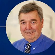
Donald Reinertsen Custo do Atraso Visão Econômica do Fluxo