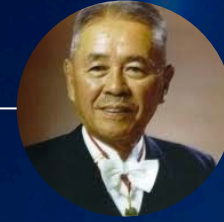
Taiichi Ohno Sistemas Puxados "Just-in-Time"