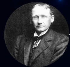
Frederick Taylor Administração Científica Tempos e Movimentos