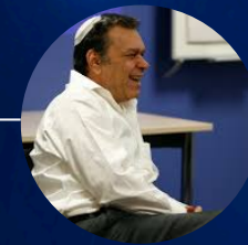
Eliyahu Goldratt Teoria das Restrições