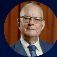
W. Edwards Deming Controle Estatístico do Processo